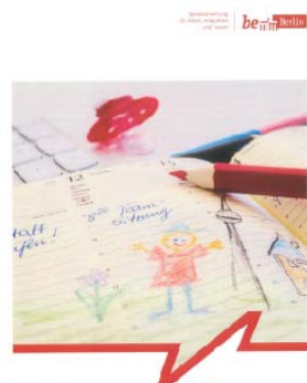
Eltern im Job Planung und Tipps Von der Schwangerschaft zum Wiedereinstieg – Chancen für Mütter, Väter und Unternehmens in Berlin